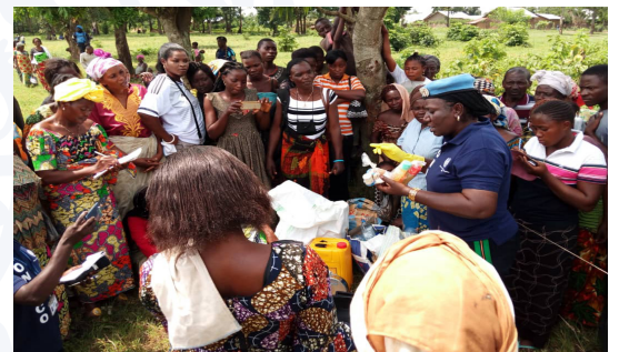
Le RFUM a aidé aussi les femmes de Rutshuru à apprendre à fabriquer du savon liquide pour leur autonomie