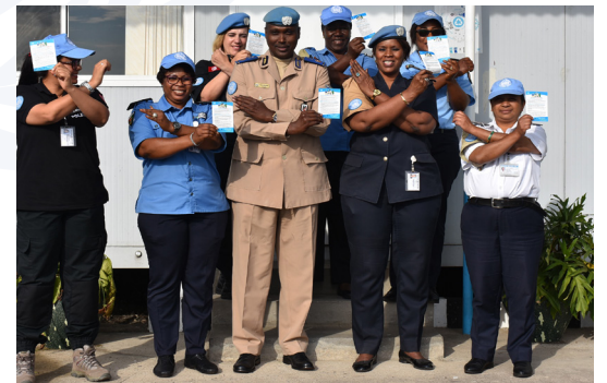
Tous les UNPOL, en première ligne le Chef de la Composante Police MONUSCO, se sont toujours dressés contre le fléau des Exploitations et Abus sexuels