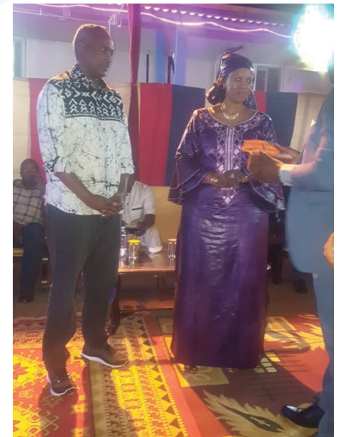
A Beni, tout comme à Goma et Kinshasa, la lauréate a été célébrée par le Secteur en présence de nombreux invités dont le Maire de la ville