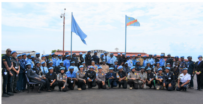
Une photo de famille des femmes UNPOL MONUSCO avec le Chef de la Composante Police et la Marraine