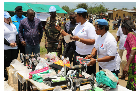
L'UNPOL Seynabou et le RFUM offrent des machines à coudre à des jeunes filles pour les rendre autonomes